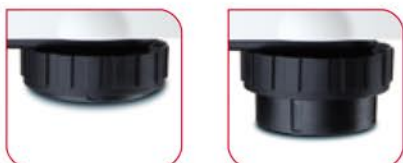
Nóżki poziomicujące umieszczone pod platformą wagi zapewniają stabilność na każdym podłożu.

seca 899 wyposażona jest we wszystkie funkcje do częstego użytku: funkcja BMI pomaga w określeniu stanu odżywienia, funkcja HOLD pozwala na zatrzymanie wyniku pomiaru na wyświetlaczu, a funkcja TARA wytarowuje np. masę ciała dzieci trzymanyh na rękach dorosłych. Odczyt wyników jest niezwykle wygodny dzięki możliwości dowolnego ustawienia kąta nachylenia panela z wyświetlaczem.