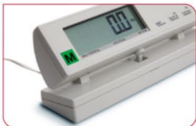
Wyświetlacz można ustawić pod kątem dogodnym do odczytu i korzystać z niego z dala od wyświetlacza.