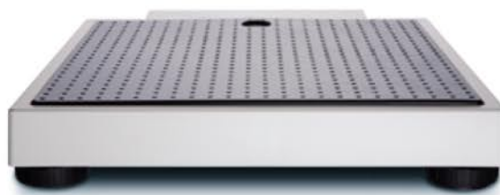
Kompaktowe wymiary i niewielka waga własna umożliwiają wygodny transport i mobilne zastosowanie.