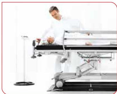
Wolnostojący wyświetlacz gwarantuje wygodny odczyt pomiarów.

Dzięki wyjątkowo stabilnej konstrukcji i bardzo wysokiej nośności 300 kg na wadze platformowej seca 657 można łatwo ważyć nawet otyłych pacjentów. Wymiary platformy pozwalają na użycie wózków inwalidzkich oraz wszystkich powszechnych systemów Roll-In i leżanek.