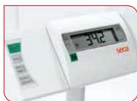
BMI jest obliczany po podaniu wzrostu pacjenta.