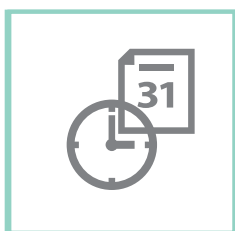
Data/godzina (zegar wewn.)