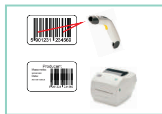
Współpraca ze skanerem i drukarką/etykieciarką