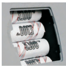
Zasilanie z akumulatorów