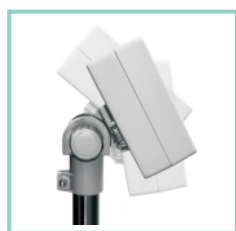
Nachylenie i obrót miernika