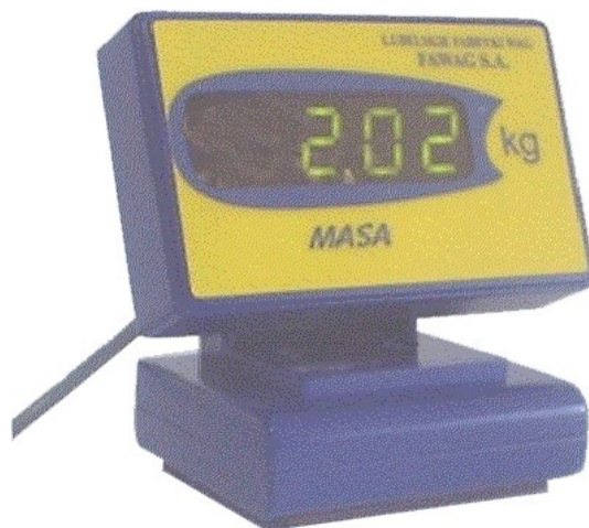
Rys.2. Wyświetlacz dodatkowy