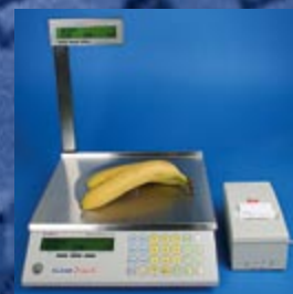
Zestaw z drukarką ELZAB Talos – rozwiązanie wagowe umożliwiające druk na papierze termicznym – ciągłym (działy tematyczne: sery, wędliny, warzywa)