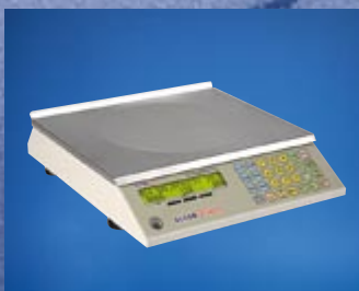
Waga w wersji płaskiej (bez wysięgnika)